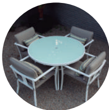
Comedor redondo blanco