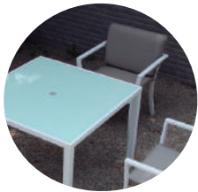
Comedor cuadrado blanco