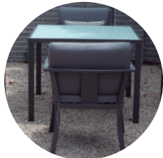
Detalle de sillón