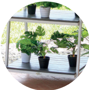
Detalle de láminas