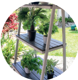
Detalle de estructura