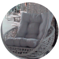
Págoda color gris