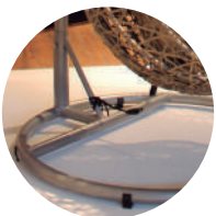
Detalles de base