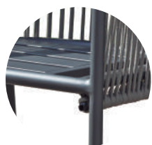
Detalle de silla