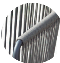
Hilos de poliéster