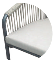
Tela Sunfiber color taupe